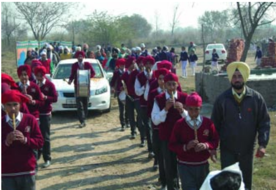
ਪਰਮ ਪੁਜਯ ਸਤਿਕਾਰਯੋਗ ਬੀਜੀ ਦੀ ਕਾਰ ਅੱਗੇ ਵਿਦਿਅਕ ਅਦਾਰਿਆਂ ਦੇ ਵਿਦਿਆਰਥੀ ਬੈਂਡ ਬਾਜੇ ਨਾਲ ਆ ਰਹੇ ਹਨ।