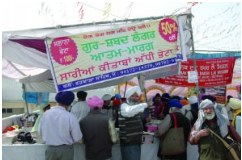
ਹੋਲੇ ਮਹੱਲੇ ਸਮੇਂ ਸ੍ਰੀ ਅਨੰਦਪੁਰ ਸਾਹਿਬ ਆਤਮ ਮਾਰਗ ਸਟਾਲ ਤੇ ਸੇਵਾਦਾਰ ਸੇਵਾ ਨਿਭਾਉਂਦੇ ਹੋਏ।

ਅੰਦਰ ਧੰਨ ਧੰਨ ਸਾਹਿਬ ਸ੍ਰੀ ਗੁਰੂ ਗ੍ਰੰਥ ਸਾਹਿਬ ਦੇ ਸਿਧਾਂਤ ਨੂੰ ਨਿਖਾਰ ਕੇ ਪੇਸ਼ ਕੀਤਾ ਹੈ। ਵੇਦਾਂ, ਪੁਰਾਨਾਂ, ਸਿਮ੍ਰਤੀਆਂ, ਗੀਤਾ, ਬਾਇਬਲ, ਅੰਜੀਰ, ਰਮਾਇਣ, ਮਹਾਂਭਾਰਤ ਪ੍ਰਾਚੀਨ ਭਾਰਤ ਦੇ ਅਨੇਕਾਂ ਧਰਮ ਗ੍ਰੰਥਾਂ ਦੇ ਤੱਤ ਸਾਰ ਸਾਹਿਬ ਸ੍ਰੀ ਗੁਰੂ ਗ੍ਰੰਥ ਸਾਹਿਬ ਜੀ ਦੇ ਗੁੱਝੇ ਸਿਧਾਂਤਾਂ ਦੀ ਵਿਆਖਿਆ, 'ਆਤਮ ਮਾਰਗ' ਮੈਗਜ਼ੀਨ ਪਿਛਲੇ 17 ਸਾਲ ਤੋਂ ਚਲਦਾ