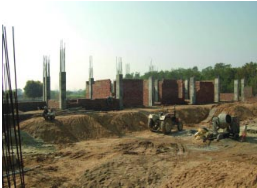
ਵਿਦਿਅਕ ਅਦਾਰੇ ਕਾਰ ਸੇਵਾ

ਚੁਕੇ ਹਨ। ਗੁਰਦਵਾਰਾ ਈਸ਼ਰ ਪ੍ਰਕਾਸ਼ ਰਤਵਾੜਾ ਸਾਹਿਬ ਵਿਖੇ