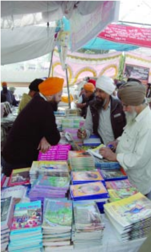
ਹੋਲੇ ਮਹੱਲੇ ਸਮੇਂ ਸ੍ਰੀ ਅਨੰਦਪੁਰ ਸਾਹਿਬ ਆਤਮ ਮਾਰਗ ਸਟਾਲ ਤੇ ਸੇਵਾਦਾਰ ਸੇਵਾ ਨਿਭਾਉਂਦੇ ਹੋਏ।

ਕੇ ਗੁਰ-ਸ਼ਬਦ ਦੀ ਸਾਂਝ ਸੰਸਾਰ ਅੰਦਰ ਵਧਾਈ ਹੈ। ਜਿਥੇ ਸਾਡੇ ਵੱਡੇ-ਵੱਡੇ ਲਿਖਾਰੀਆਂ ਨੇ ਸਾਡੇ ਵਿਸ਼ਵਾਸ ਤੇ ਠੋਸ ਪਹੁੰਚਾਈ ਉਸ ਨੂੰ ਆਪ ਜੀ ਨੇ ਪੂਰਾ ਵਾਰ ਕੇ ਸਾਰੀਆਂ ਅਧੁਨਿਕ ਲਿਖਤਾਂ ਨੂੰ ਖੋਖਕੇ ਅਪਣੀਆਂ ਵੀਚਾਰਾਂ ਸੰਸਾਰ ਅੱਗੇ 3-3 4-4 ਘੰਟੇ ਦੇ ਦੀਵਾਨਾਂ