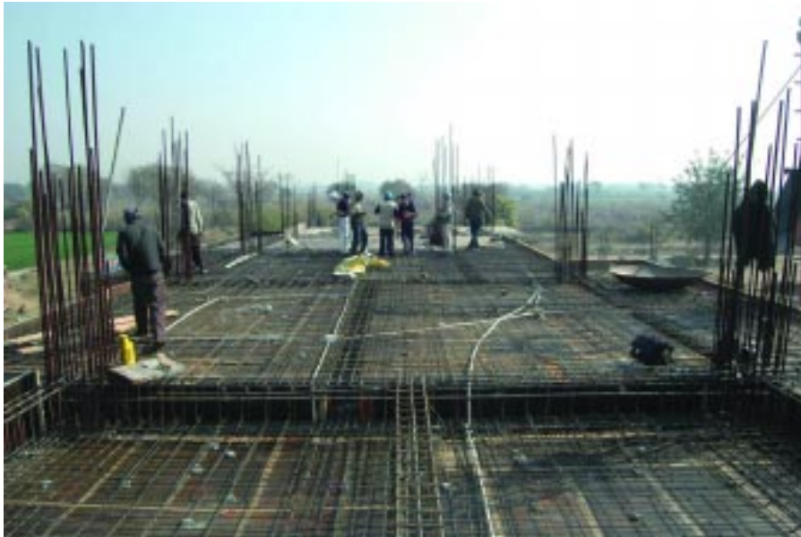
ਵਿਦਿਅਕ ਅਦਾਰੇ ਕਾਰ ਸੇਵਾ

ਹੈ। ਸੰਗਤਾਂ ਦੇ ਗਿਆਤ ਲਈ ਬੇਨਤੀ ਕਰਦੇ ਹਾਂ ਕਿ ਉਸ ਅਸਥਾਨ ਤੋਂ ਆਤਮ ਮਾਰਗ ਹਿੰਦੀ ਪੰਜਾਬੀ ਵਿੱਚ ਪ੍ਰਾਪਤ ਕਰ ਸਕਦੇ ਹੋ ਜੀ। ਅਸ਼ੋਕ ਨਗਰ ਮੱਧ ਪ੍ਰਦੇਸ਼ ਵਿਖੇ 'ਈਸ਼ਰ ਪ੍ਰਕਾਸ਼ ਵਰਿਆਮ ਸਰ' ਦੇ ਨਾਮ ਤੇ ਸ਼ਸ਼ੋਭਿਤ ਅਸਥਾਨ ਵਿਖੇ ਹਰ ਮਹੀਨੇ ਦੀ 6 ਤਰੀਕ ਨੂੰ ਦੀਵਾਨ ਸੱਜਦੇ ਹਨ। ਉਥੇ ਵੀ ਆਤਮ ਮਾਰਗ ਮਾਸਿਕ ਪਤ੍ਰਿਕਾ ਦਾ ਪੂਰਾ ਪ੍ਰਬੰਧ ਹੈ ਸਬੰਧਤ ਸੰਗਤਾਂ ਲਾਹਾ ਪ੍ਰਾਪਤ ਕਰਨ ਦੀ ਕ੍ਰਿਪਾਲਤਾ ਕਰਨ ਜੀ।