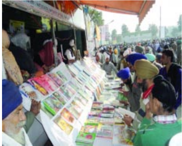
ਹੋਲੇ ਮਹੱਲੇ ਸਮੇਂ ਸ੍ਰੀ ਅਨੰਦਪੁਰ ਸਾਹਿਬ ਆਤਮ ਮਾਰਗ ਸਟਾਲ ਬੱਸ ਦਾ ਦ੍ਰਿਸ਼।

ਲੰਗਰ ਚਲੈ ਗੁਰ ਸਬਦਿ - ਸਿੱਖ ਸੰਪ੍ਰਦਾਵਾਂ ਅੰਦਰ ਅੱਜ ਦੇ ਯੁੱਗ ਅੰਦਰ ਦੇਖਿਆ ਜਾਵੇ ਤਾਂ ਬਹੁਤ ਵੱਡਾ ਸੇਵਾ ਦਾ ਜਜ਼ਬਾ ਹੈ ਸੰਸਾਰ ਅੰਦਰ ਕਿਤੇ ਵੀ ਗੁਰਦੁਆਰਾ ਸਾਹਿਬ ਬਣ ਜਾਵੇ ਉਥੇ ਗੁਰੂ ਕੇ ਲੰਗਰ ਜਰੂਰ ਚਾਲਾਏ ਜਾਂਦੇ ਹਨ। ਭਾਵੇਂ ਆਪ ਜੀ ਸੰਸਾਰ ਦੇ ਕਿਸੇ ਵੀ ਕੋਨੇ ਅੰਦਰ ਚਲੇ ਜਾਵੇ। ਸਿੱਖ ਪੰਥ ਦੇ ਵੱਡੇ ਜੋੜ ਮੇਲਿਆਂ ਤੇ ਤਾਂ ਇਸ ਸੇਵਾ ਅੰਦਰ ਜਿਥੇ ਵੱਡੀਆਂ ਸੰਪ੍ਰਦਾਵਾਂ ਸੇਵਾ ਨਿਭਾਉਂਦੀਆਂ ਹਨ ਉਥੇ ਪਿੰਡਾਂ ਦੀਆਂ ਸੰਗਤਾਂ ਅੰਦਰ ਵੀ ਬਹੁਤ ਉਤਸ਼ਾਹ ਗੁਰੂ ਕੇ ਲੰਗਰਾਂ ਦੀ ਸੇਵਾ ਦਾ ਹੈ। ਰਤਵਾੜਾ ਸਾਹਿਬ ਵਾਲੇ ਮਹਾਂਪੁਰਖਾਂ ਦੀ ਦੇਣ ਜੋ ਆਪ ਜੀ ਨੇ ਆਪਣੇ ਦੀਵਾਨਾਂ