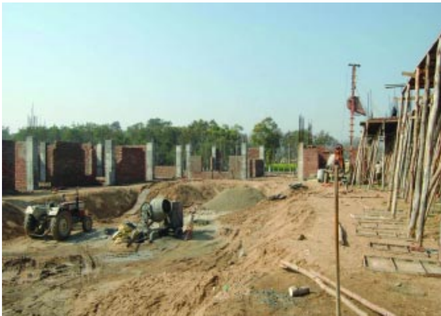
ਵਿਦਿਅਕ ਅਦਾਰੇ ਕਾਰ ਸੇਵਾ

ਚੁਕੇ ਹਨ। ਗੁਰਦਵਾਰਾ ਈਸ਼ਰ ਪ੍ਰਕਾਸ਼ ਰਤਵਾੜਾ ਸਾਹਿਬ ਵਿਖੇ